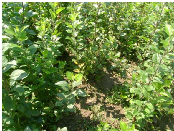
Aspect din marcotiera M 106