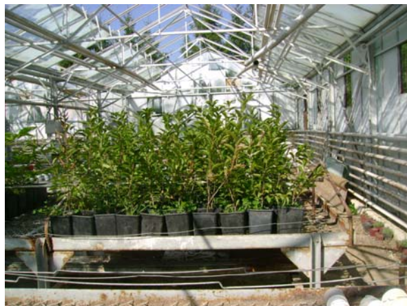
Plante de IPC 7 – fortificate