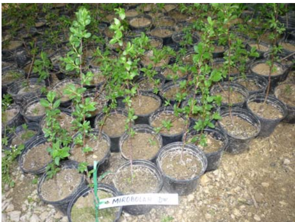
Fortificare Mirobolan dwarf obținut in vitro