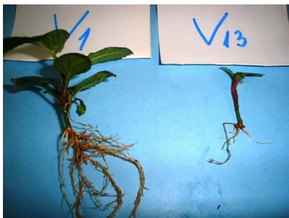
Influența substratului asupra STAS la portaltoiul M 106 V1 -inmultire in vitro V13-inmultire clasica