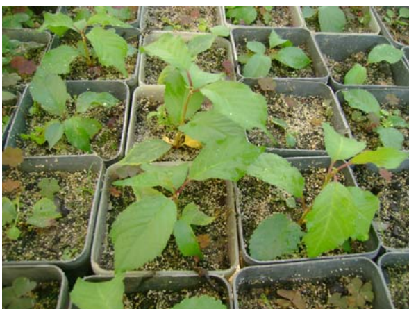
Fortificarea plantelor de IPC 7