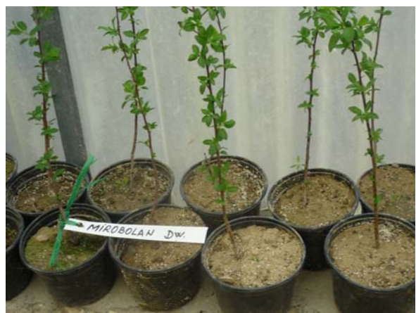
Aspecte privind uniformitatea plantelor Mirobolan dwarf, obținute in vitro