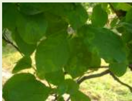
PPV la prun- simptome pe frunze(original)