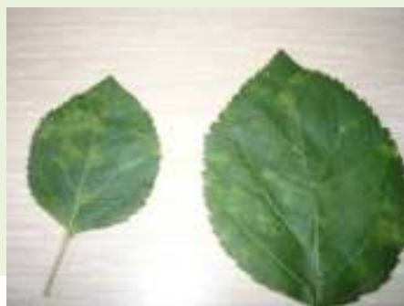
ACLSV la măr-simptome pe frunze (original)