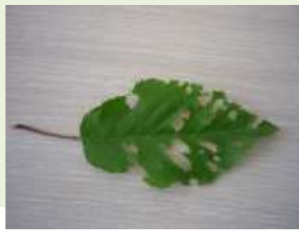
PNRSV la cireș-simptome pe frunze(original)